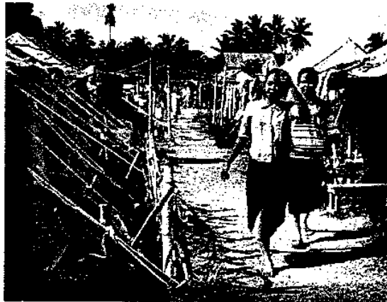
Zeltlager in Aceh